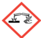
GHS05 Działanie żrące